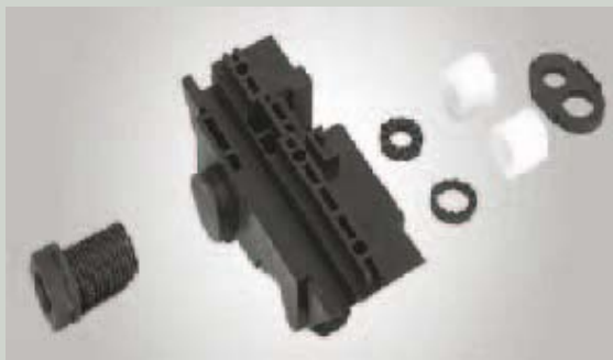
Verschlusskeil mit Stopfbuchse