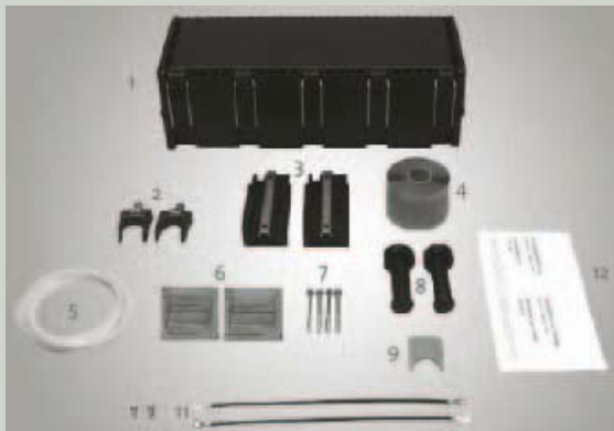
Lieferumfang UCA0 Muffe